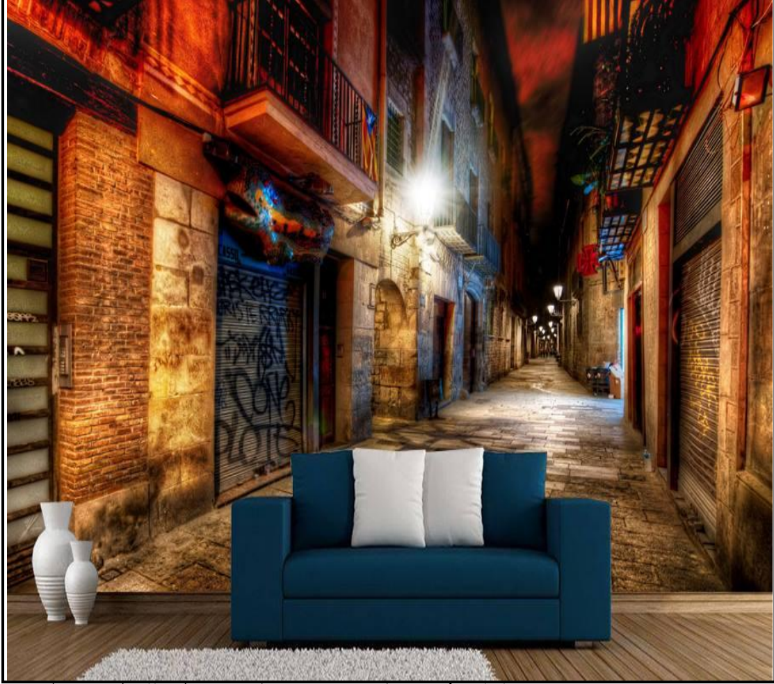
نموذج رقم (7)

نموذج رقم (7):- تم استخدام ورق جدران ثلاثي الأبعاد بنمط شرقي جديد يربط بين الحداثة والموروث الحضاري (الشناشيل).