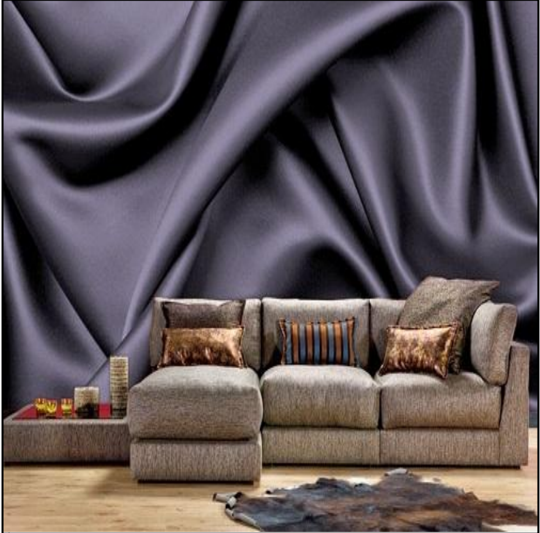
نموذج رقم (9)

نموذج رقم (9):- في هذا النموذج ورق الجدران يوحى للمتلقى باستخدام قماش من الستان الناعم الملمس وكأنه لوحة تمثل أمواج البحر الهادئة حيث لم تستخدم ألوان وتفصيل كثيرة في هذا الورق واتصفت بالبساطة والنعومة وهذه الطيات الموجودة في ثنيات القماش أعطى تدرج لوني بين العمق الغامق وبين سطح القماش الفاتح اللون وكأنه لوحة فنية متناسقة اللون والشكل رغم أن اللون المستخدم هو لون واحد ( الأزرق ) ، أما الأريكة فكانت تحمل تفاصيل دقيقة وكثيرة من حيث الخطوط والألوان المستخدمة في الوسائد إضافة إلى منضدة جانبية تكمل تفاصيل الأريكة، أما نقطة الجذب هنا تمثلت بفرش الأرضية المتمثل بجلد حيوان ( الدب ) وهي التي شدت نظر المتلقي عند النظر إليها.